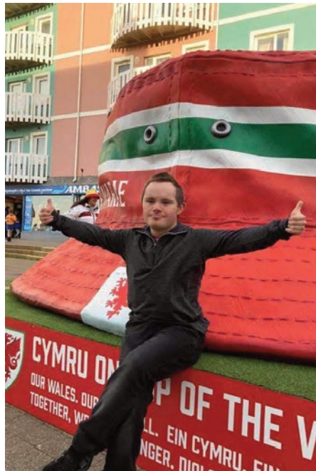
Huw o flaen yr het yn Aberystwyth

Efallai y bydd eglwysi am ystyried yn ofalus amseriad oedfaon drama'r geni a phartïon Nadolig y plant ar y Sul hwnnw rhag torri ar draws mwynhad y gêm derfynol i lawer o deuluoedd. Bydd rhai eglwysi yn darlledu'r